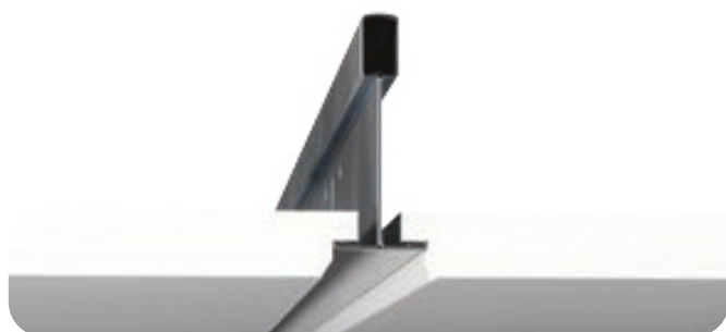
Ivica E15: Izložena, uvučena T-15 rešetka. Demontažna/Obojena.