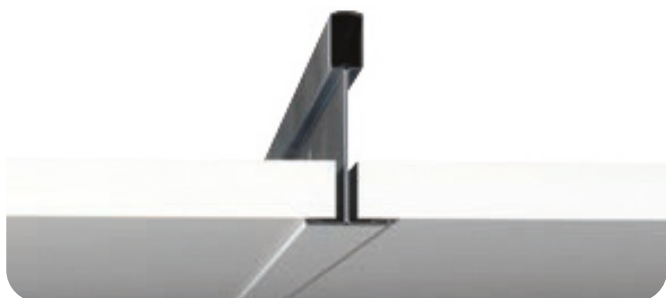
Ivica A: Izložena T-15 mreža, Izložena T-24 mreža. Demontažna/Obojena.