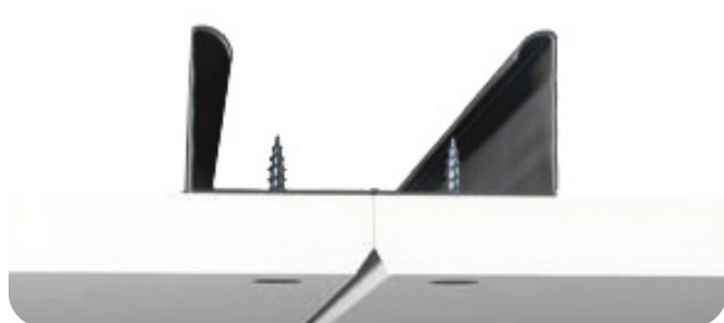
Ivica B: Drvene letve, primarni/sekundarni sistem, GK(CD)-sistem. Nije demontažna. Nebojena.